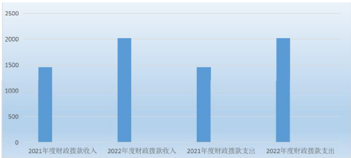
图 2： 2021-2022 年财政拨款收支情况（单位：万元）